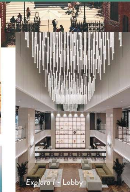
Explora I - Lobby