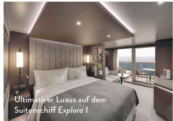
Ultimativer Luxus auf dem Suitenschiff Explora I