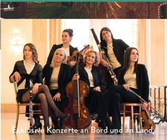
Exklusive Konzerte an Bord und an Land