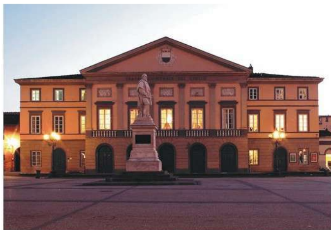
Teatro del Giglio Giacomo Puccini