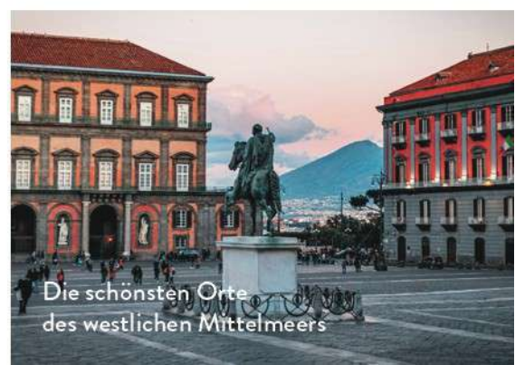
Die schönsten Orte des westlichen Mittelmeers