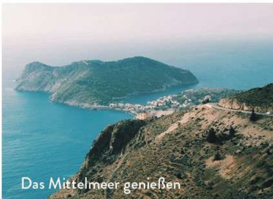
Das Mittelmeer genießen