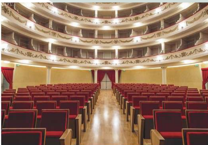
Teatro Sociale di Camogli

Portofino, ein idyllischer Küstenort an Italiens Riviera, ist ein exklusiver Rückzugsort mit pastellfarbenen Häusern, Luxusboutiquen und Adelssitzen in den Olivenhängen. Über Skulpturengärten führt ein Weg zur Chiesa di San Giorgio mit Blick auf etruskische Villen. Darüber hinaus erwartet Sie ein außergewöhnliches Konzert. Gabriela Montero und Daniel Hope treten gemeinsam in einem exklusiven Konzert im Teatro Sociale di Camogli auf. In der einzigartigen Atmosphäre dieses historischen Theaters erwartet das Publikum ein Abend voller musikalischer Virtuosität, Inspiration und Ausdruckskraft.