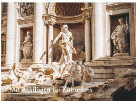
Mit Ausflügen für Kulturfans