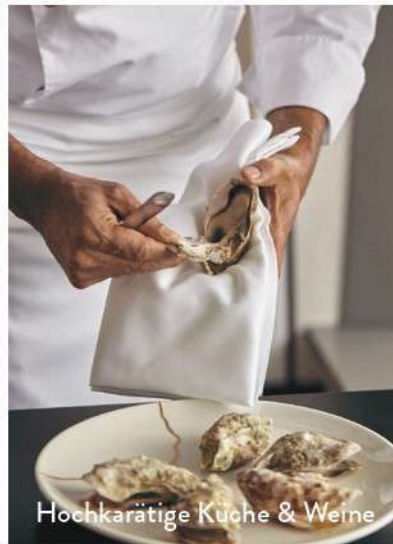
Hochkarätige Küche & Weine