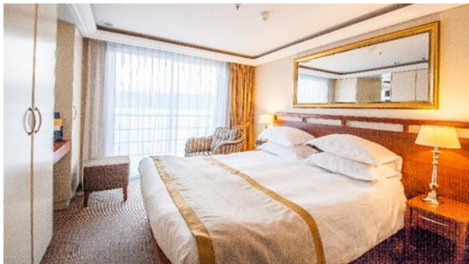
MS Klimt, Doppelkabine Cello- bzw. Violindeck