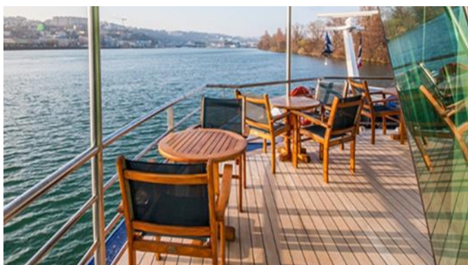
MS Klimt, Cellodeck, Außenbereich